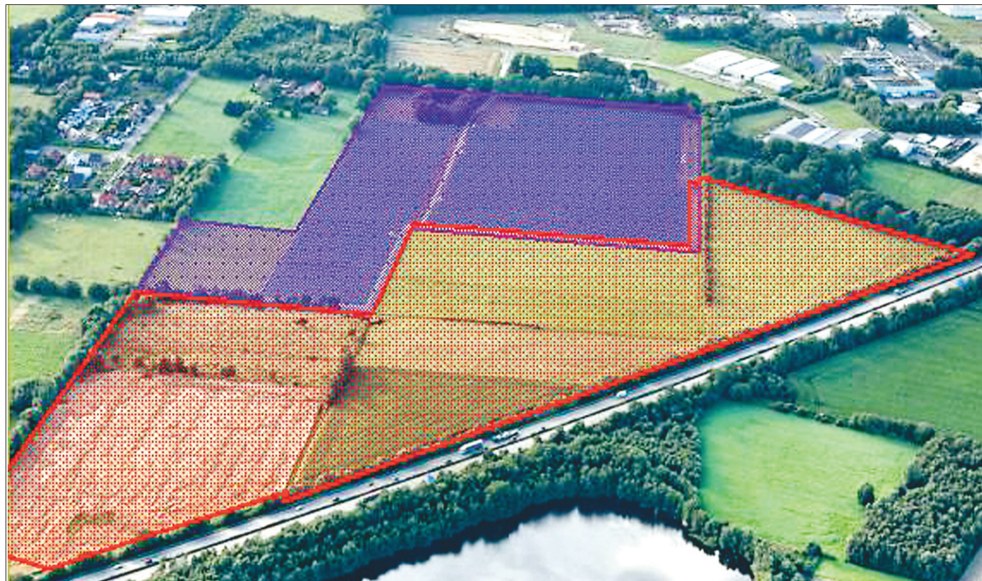
Die Photovoltaikanlage in Tweelbäke: Rot umrandet ist die Erweiterungsfläche.

STADTENTWICKLUNG „Solen Energy“ erweitert Anlage um 90 000 Quadratmeter